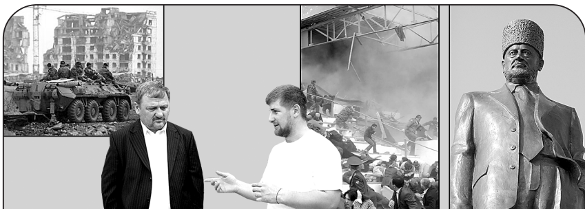
Так выглядел Грозный в 1995 году

И Ахмад Кадыров в 2004 году был убит террористами во время праздничного парада ко Дню Победы на стадионе в Грозном. За что? Он срывал их планы.